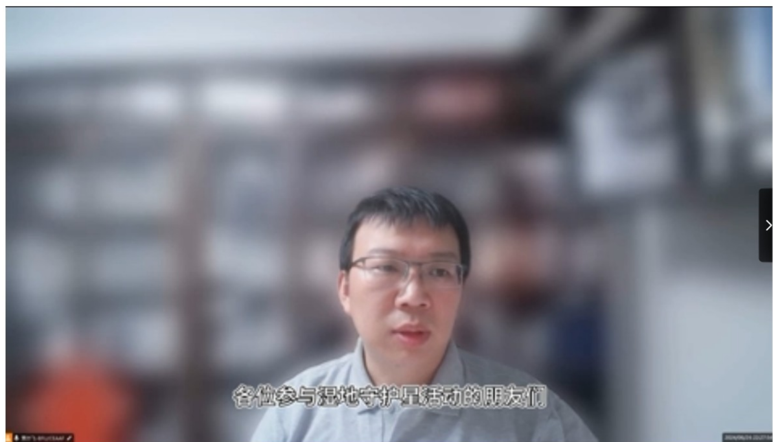
课程导师介绍中国湿地水鸟情况