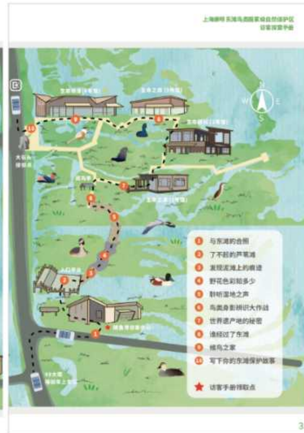
《东滩自然一刻访客体验手册》部分内容