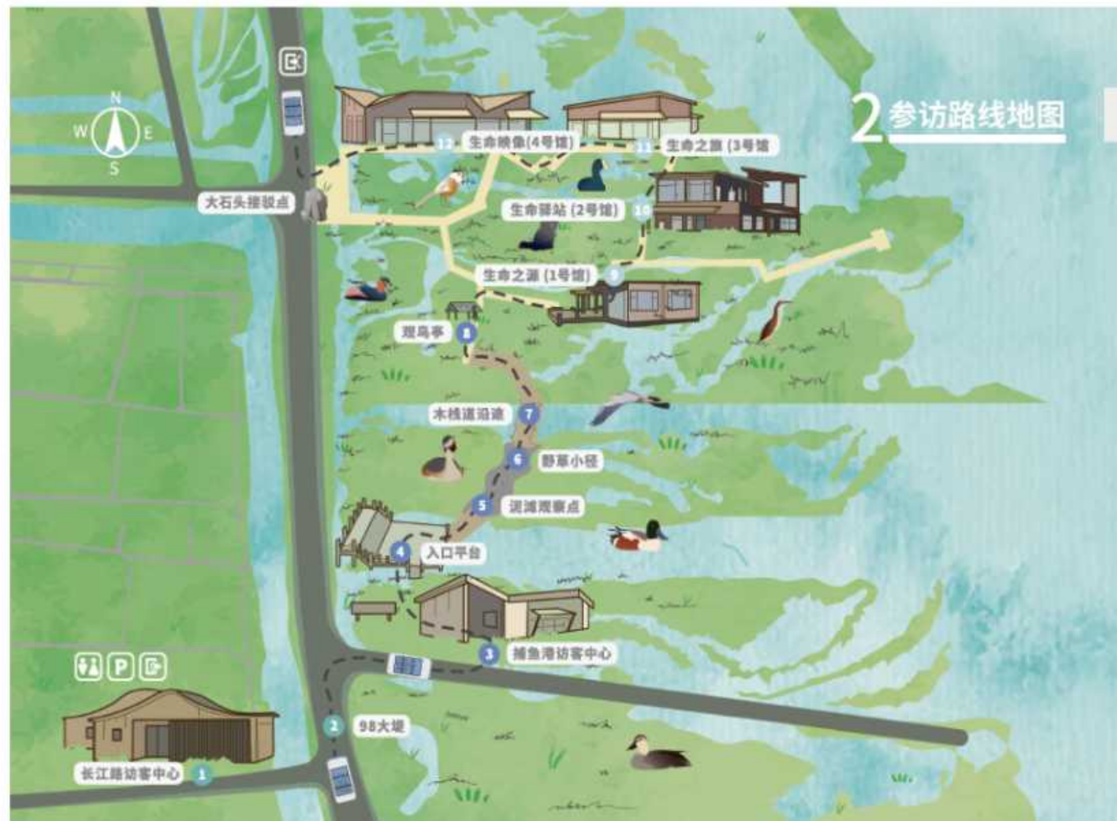
图 1-2 《东滩自然一刻人员解说手册》部分内容

本线人员解说方案，将针对初次来东滩的大众访客，以自然一刻主题步道为基础，借助人员解说和自助参观的形式，带领访客认识步道的生物多样性，从中认识东滩湿地生物多样性的特点，及其生物与东滩湿地之间密切的依存关系。同时，考虑人员解说活动的整体性，解说方案将适当结合长江路访客中心以及后续生命之源等四馆的人员解说内容，进行总体规划与讲解内容设计。