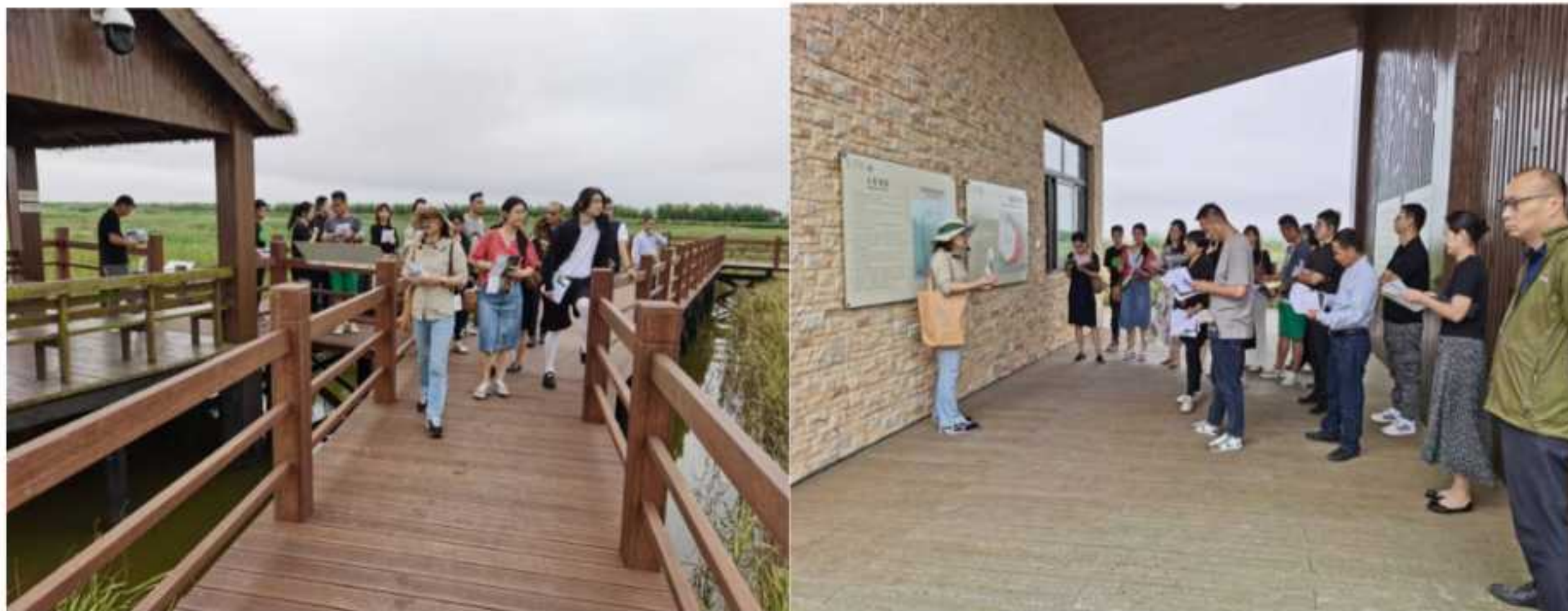
图 4-5：东滩自然一刻公众导赏活动