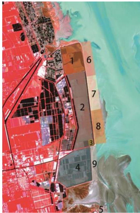
条子泥调查样区设置（右）