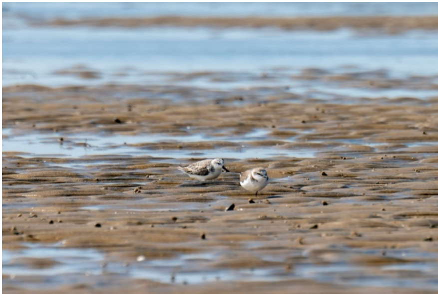
图片：勺嘴鹬（左）和它的朋友环颈鸻